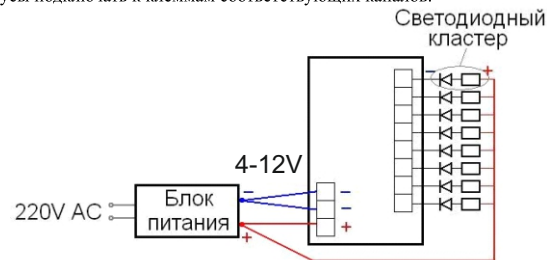
Рис. 2 Схема подключения контроллера

Пропустите провода через кабельный ввод и подключите их к клеммам согласно схемы подключения (рис. 2), соблюдая полярность подключения, надежно зафиксируйте их винтами. У светодиодных линий (кластеров) общий является плюс напряжения питания. Минусы подключать к клеммам соответствующих каналов.